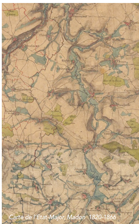
Carte de l'Etat-Major, Madon 1820-1866