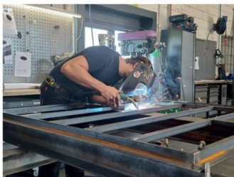
Le Pays du Saintois concentre un vivier de PME artisanales très créatives.