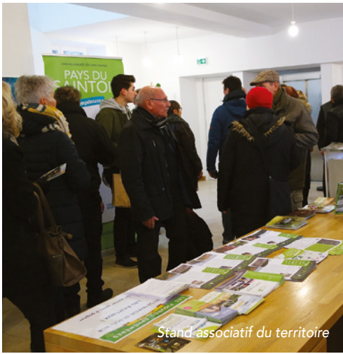
Stand associatif du territoire

« LE MARCHÉ DE NOËL DE LA COLLINE DE SION S'EST DÉROULÉ LES SAMEDI 8 ET DIMANCHE 9 DÉCEMBRE. CETTE ANNÉE, LA PROGRAMMATION DES ANIMATIONS AVAIT ÉTÉ CONSIDÉRABLEMENT DYNAMISÉE : FANFARE, DÉAMBULATIONS, MINI-CONCERT, BALADE À PONEY, STAND PHOTO, LECTURE DE CONTES, ATELIERS ARTISTIQUES ET CRÉATIFS, CONCERT DE GOSPEL, ... »