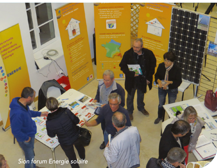
Sion forum Energie solaire