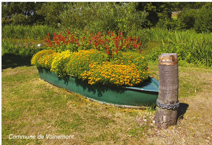
Commune de Voinemont

ATTACHÉ À LA QUALITÉ DE NOTRE CADRE DE VIE PAR L'EMBELLISSMENT DES VILLAGES LA COMMISSION FLEURISSEMENT DE LA COMMUNAUTÉ DE COMMUNES POURSUIT L'ORGANISATION DU CONCOURS DE FLEURISSEMENT.