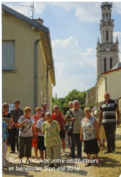
Temps convivial entre conducteurs et bénévoles Sion été 2018