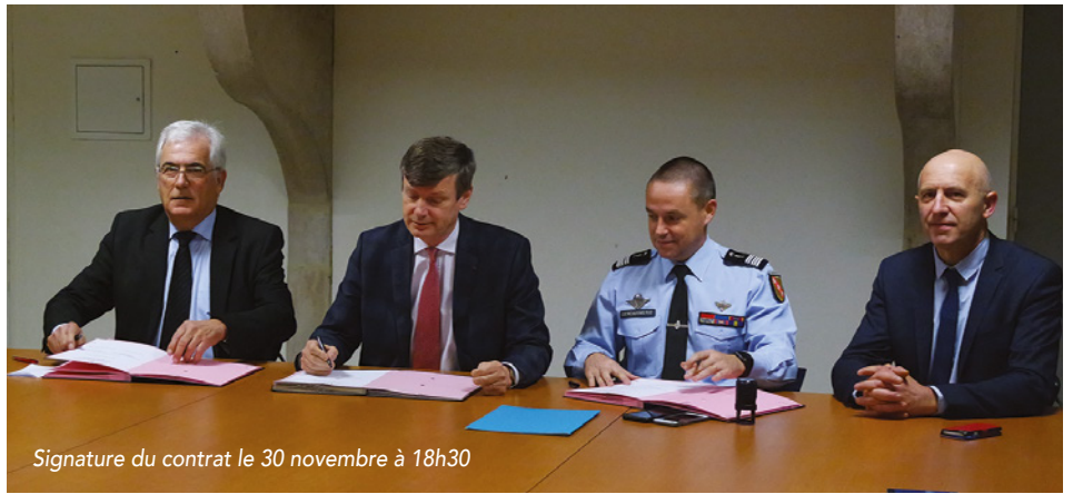
Signature du contrat le 30 novembre à 18h30

Le bureau d'études chargé d'accompagner la CCPS vient d'être recruté à l'issue d'une procédure de marché public qui a duré tout l'été, et les travaux en communes vont pouvoir débuter dès janvier 2019.