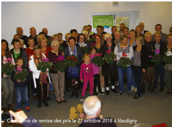
Cérémonie de remise des prix le 27 octobre 2018 à Vaudigny