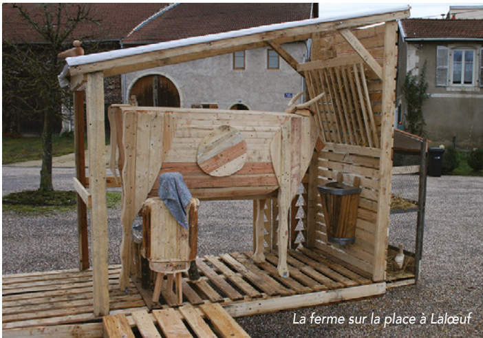
La ferme sur la place à Lalœuf

Durant le marché de Noël, la CCPS animait un stand associatif aux côtés de 12 associations du territoire à l'intérieur des locaux de la Cité des Paysages : Espace Mémoire Lorraine 39-45, TEM, Association du Patrimoine de Neuville, Centrales Villageoises, Association de Défense de la Ligne Ferroviaire, Foyers Ruraux de Tantonville et de Bainville aux Miroirs, Ecole de Musique du Saintois, Musée Agricole et Rural de Vroncourt, Pêcheurs à la Ligne du Saintois, Randonneurs du Saintois et Gîtes de France 54. »