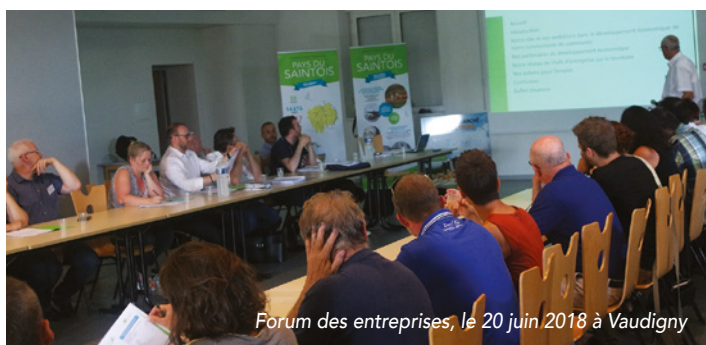
Forum des entreprises, le 20 juin 2018 à Vaudigny

A ce jour, des aides restent encore disponibles pour les opérations liées à l'accessibilité (2/3 dossiers), l'aménagement intérieur (2/3 dossiers) et l'aménagement extérieur (5/6 dossiers). Cette opération d'accompagnement des entreprises du territoire aura pour terme la fin de l'année 2019. Nous invitons donc tous les artisans et commerçants à se rapprocher de la communauté de communes pour obtenir toutes les informations nécessaires pour déposer un dossier d'aide à l'amélioration de leur activité.