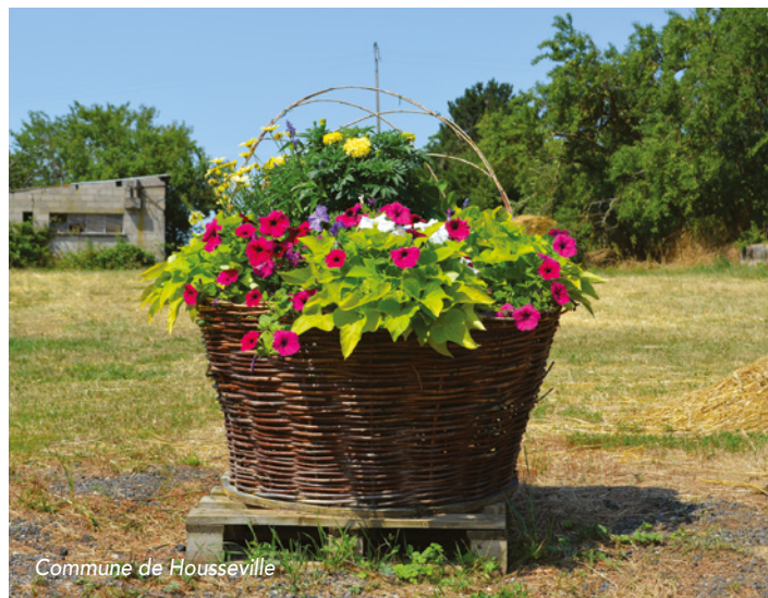
Commune de Housseville

Le Président de la CCPS a tenu à remercier les bénévoles, les communes participantes, les nombreux particuliers qui participent au fleurissement de leurs maisons ainsi que l'association Saintois Patrimoine fleurissement.