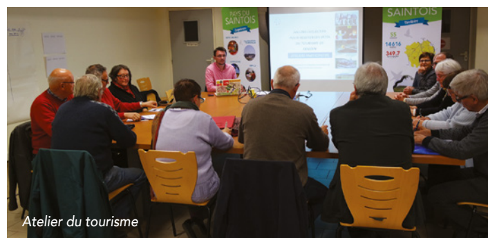
Atelier du tourisme

L'atelier de la CCPS du jeudi 25 octobre a rassemblé une quinzaine de personnes : associations sportives, musée, hébergeurs touristiques et élus. Il a permis de réfléchir sur plusieurs sujets : atouts, faiblesses, promotion & communication... »