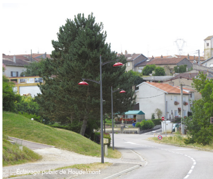
Éclairage public de Houdelmont

Les bénéfices de l'extinction sont nombreux, aussi bien pour la faune, la flore que le budget communal. Certains éteignent depuis de nombreuses années, d'autres se sont lancés récemment comme la commune d'Houdreville qui a sollicité sa population avec un questionnaire puis une réunion publique pour enfin aboutir à cette nouvelle démarche vertueuse. D'autres encore y réfléchissent et profitent du « jour de la nuit » pour entamer une première pratique d'extinction comme à Germonville : https://www.jourdelanuit.fr/