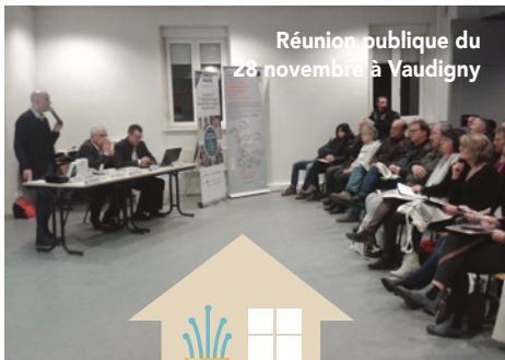
Réunion publique du 28 novembre à Vaudigny