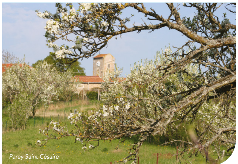
Parey Saint Césaire