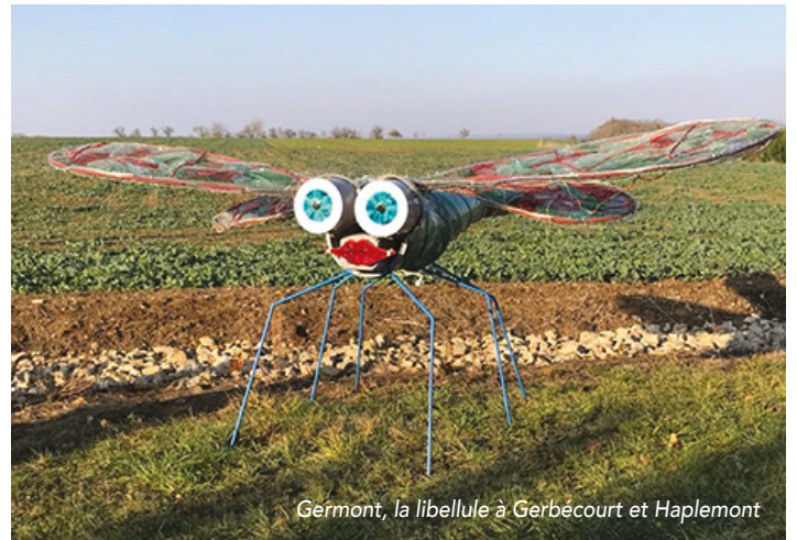
Germont, la libellule à Gerbécourt et Haplemont