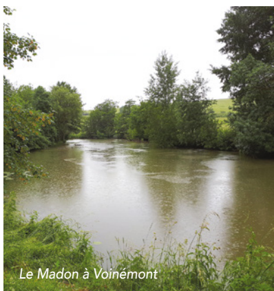
Le Madon à Voinémont

Nombre de communes du Saintois arrosées : 14