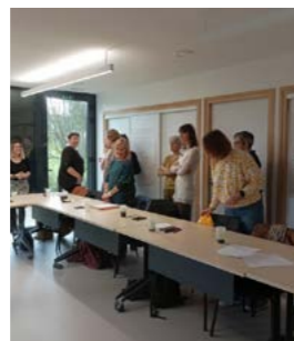
Approfondissement troubles neuro développementaux