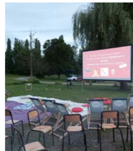
Cinéma en plein air juillet 2024