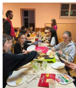
Atelier Jeunes -Projet de territoire-