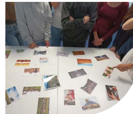
Atelier Jeunes du 17 octobre

La concertation est désormais terminée et laisse place à un travail de collecte des échanges et de retranscription afin de traduire les objectifs et les enjeux prioritaires de développement pour notre territoire d'ici 2035. Un programme d'action sera réalisé et ce nouveau projet fera l'objet d'une présentation à l'ensemble des acteurs du territoire courant 2025.