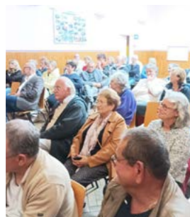
Ciné-débat 27 septembre 2024