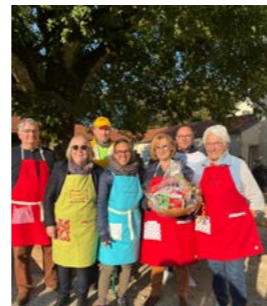
Fête de la soupe 15 septembre 2024