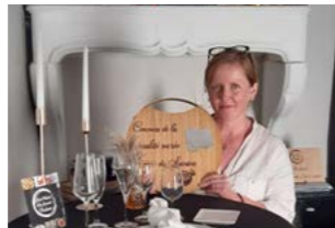
2 ème : L'art Home des Saveurs