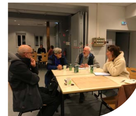
Atelier développement économique du 18 octobre