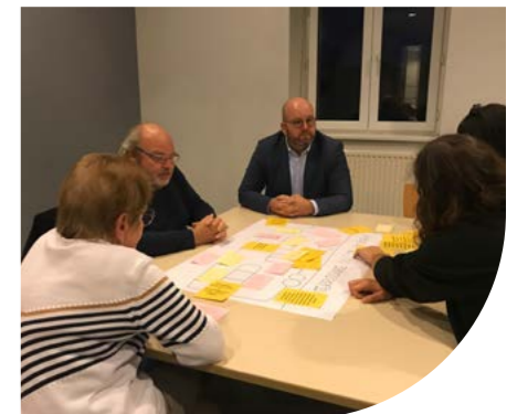
Atelier élus et habitants du 21 octobre