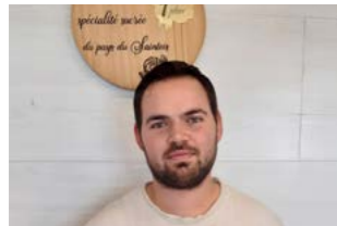
1 er : Le fournil du Château d'Haroué

de l'Office de Tourisme du Pays du Saintois, des agents de la Communauté de Communes, soutenu également par les Amis de Vézelize pour leur accueil chaleureux sur le marché le jour de la sélection finale. Un grand merci également à D. Gravure pour la création des trophées et à France Bleu Sud Lorraine pour leur soutien médiatique. Cette réussite collective est le fruit de l'engagement de chacun, et c'est avec enthousiasme que nous ouvrons aujourd'hui un nouveau chapitre dans notre histoire gastronomique. Ensemble, continuons à célébrer et à faire rayonner les richesses de notre territoire !