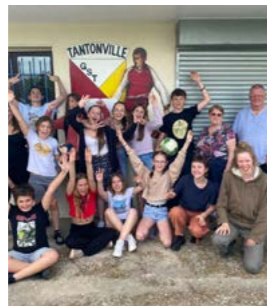
Colonie itinérante juillet 2024