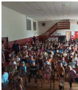
Spectacle Bulles de rêve juillet 2024